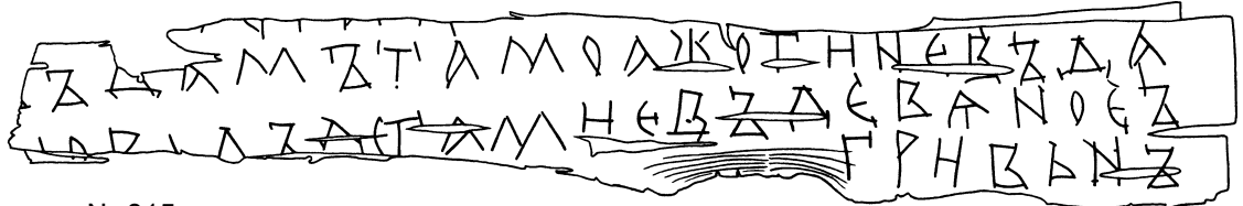
Прорись грамоты № 815